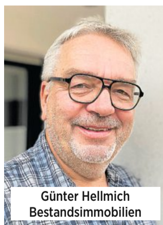
Günter Hellmich Bestandsimmobilien